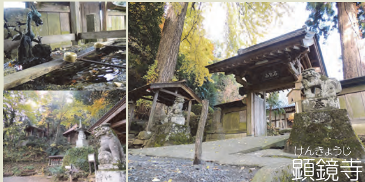
けんきょうじ 顕鏡寺

【顕鏡寺】 本尊は虫封じのお寺として古くから参拝客で賑わっています。境内には蛇木杉や大イチョウ(かながわの名木100選)など古木が多くあります。