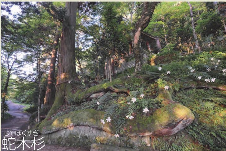
じゃぼくすぎ 蛇木杉

【蛇木杉】 広小路より奇岩怪石を見ながら登ってきて、急な二十七段の石段を上り終わったところに、蛇木杉がそびえたっています。この蛇木杉の樹齢は400年以上と言われ、樹の太さは6.3mあり、石老山中、最大の杉です。杉の根、二本が地上に露出しており、その姿は蛇が横たわっているように見えるところから蛇木杉と名付けられました。また、二本の根を雄龍、雌龍と言い、この龍がすぐ上にある鐘楼に登らんとする姿は、雄大であり、神秘的。