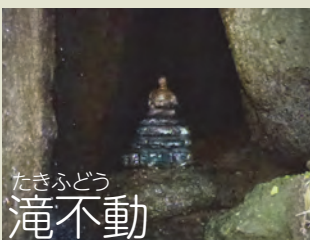
たきふどう 滝不動

【蛇木杉】 広小路より奇岩怪石を見ながら登ってきて、急な二十七段の石段を上り終わったところに、蛇木杉がそびえたっています。この蛇木杉の樹齢は400年以上と言われ、樹の太さは6.3mあり、石老山中、最大の杉です。杉の根、二本が地上に露出しており、その姿は蛇が横たわっているように見えるところから蛇木杉と名付けられました。また、二本の根を雄龍、雌龍と言い、この龍がすぐ上にある鐘楼に登らんとする姿は、雄大であり、神秘的。